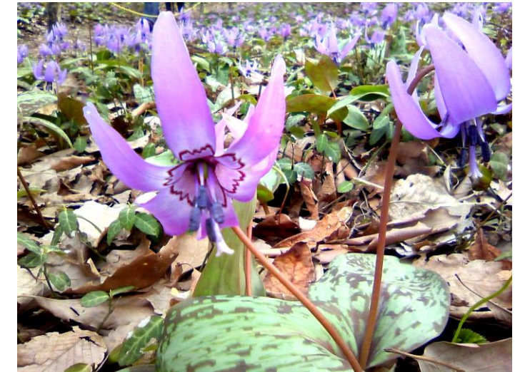
「スプリング・エフェメラル」(春の妖精) カタクリの花