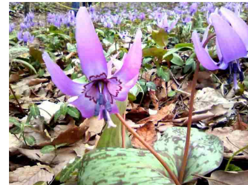
「スプリング・エフェメラル」(春の妖精)カタクリの花