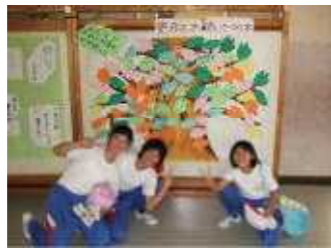
あいさつの葉がいっぱい (あいさつの木)