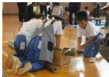
学年を越えて協力、創造 (道具の時間)