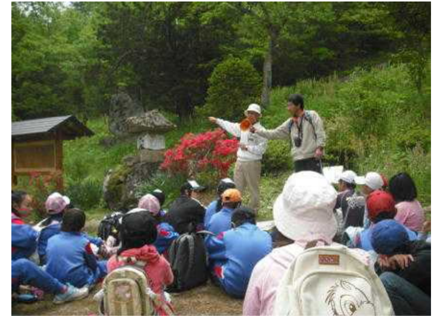
親子ふれあいデー(目洗い石にて)