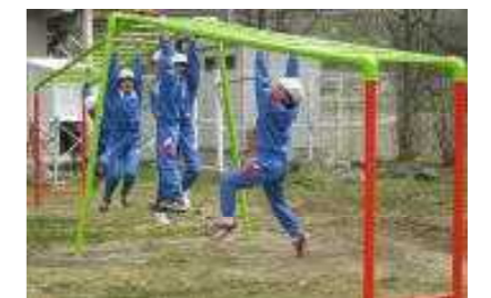
遊具でなかよく元気に(新しい雲梯にて)