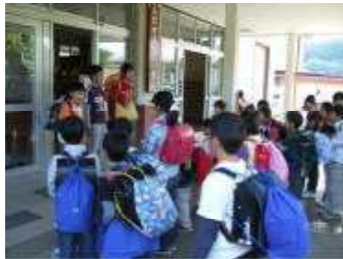
私の今日は・・・でした。 (下校前の全校帰りの会)