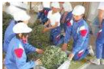
たくさんのよもぎが集まりました (よもぎ集め)