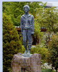
昭和62年9月 作：滝澤 石 先生