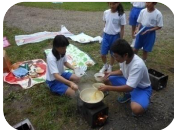
キャンプ場で夕食づくり