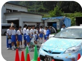
中央タクシーで職場見学