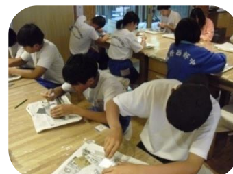
国営アルプスあずみの 公園での石器づくり