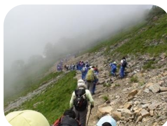
険しい登山道を進み 丸山ケルンへ