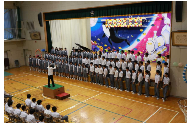
<後輩に想いを伝えた“3学年合唱”>