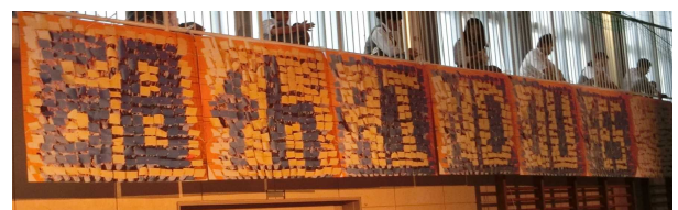
暑い中、気持ちを一つにして 創り上げた“全校制作”

ずっと楽しみにしていた最後のりんどう祭が終わってしまいました。1日目は特別企画がとても楽しかったです。昨年と内容が大きく変わり、学年を越えて団結力が深まりました。負けてしまったけれど、こんなに楽しい企画を作ってくれた役員さんには感謝です。最初から最後までりんどう祭を盛り上げようと、One Stageの復活など私たちのために一生懸命になって下さった〇〇先生、他にも役員でない3年生たちが朝早くから校庭の整備をしてくれたり、たくさんの人たちに感謝の気持ちでいっぱいです。そして3学年皆と大好きな総務役員と最後のりんどう祭を作り上げられたことをとても誇りに思います。最高のりんどう祭でした。皆ありがとうございます！