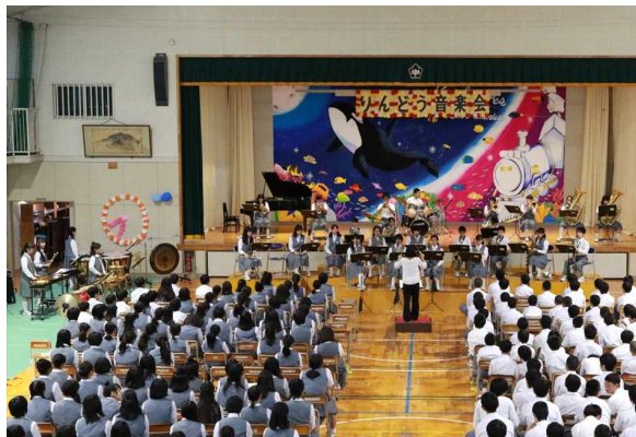
<北信大会で金賞を受賞した“吹奏楽部コンサート”>