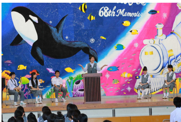
<気持ちを伝えた“弁論大会”“英語スピーチ”>

9月29日(金)、30日(土)に「Memories～214の輝きが一つになる瞬間～」のテーマのもと、第68回りんどう祭が開催されました。見応え聞き応えのあった国語弁論・英語スピーチ、One Stage、特別企画(体育祭)、吹奏楽部の演奏、音楽会等々…。ステージ発表・展示発表共に、日頃の学習の成果を発表する場として、214人の多くの輝きが見られた充実した2日間になりました。