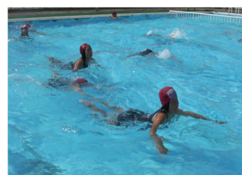
今シーズンの成果は？

休み明け、各学級の廊下や教室、ベランダには、夏休み中の宿題の一研究や工作、鉢植えなどが並んでいます。苦勞して作ったり大切に育てたりした跡が見えるようです。保護者の皆様にも、学習面で様子を見ていただいたり、プール当番でも暑い中ご協力をいただいたりと、ありがとうございました。