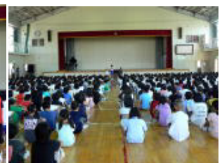
落ち着いた雰囲気での始業式