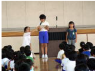
お友達の前で研究発表

新たに4名の転入生を迎え、717名で2学期がスタートしました。連日報道されている猛暑・酷暑ですが、暑さに負けず元気にスタートできたことはとても嬉しいことです。86日間の2学期には、大きな行事がたくさんありますが、行事を通して子どもたちが成長していく姿を支えていきたいと思います。