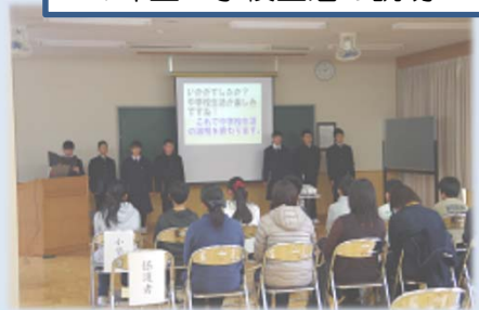
1年生 学校生活の説明