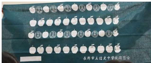
本年度、同窓会より日本手ぬぐいを プレゼントいただきました。