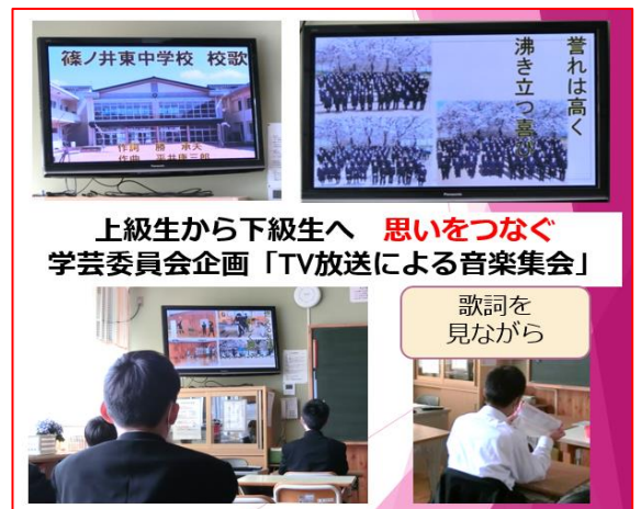
上級生から下級生へ 思いをつなぐ 学芸委員会企画「TV放送による音楽集会」

「校歌に込められた思いを共有し、下級生にもつなげていきたい」・・・そんな、校歌への強い「志」を感じた音楽集会でした。