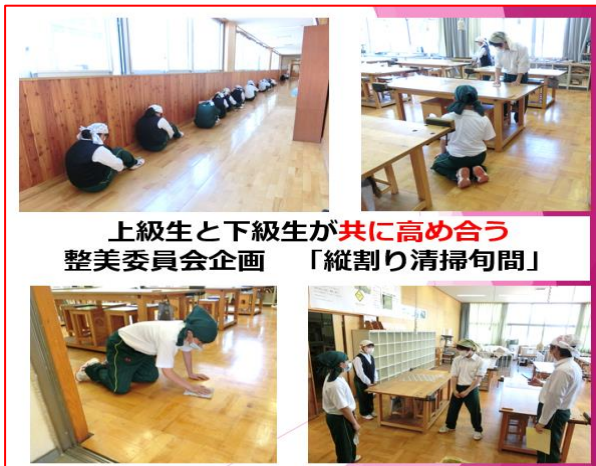
上級生と下級生が共に高め合う 整美委員会企画 「縦割り清掃旬間」

の「場を清める」という気持ちとそれを受けたこのような活動を大事に、今後も環境整備に努めてまいります。