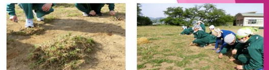
生徒有志180名が参加 福祉環境委員会企画 「校内奉仕活動 グリーンアワー」

ご存知の通り、本校の校庭は草が生えやすく、庁務の先生が頻りに草刈りをしています。追いつかないほどです。それだけに、日頃、校庭を使用している生徒自身