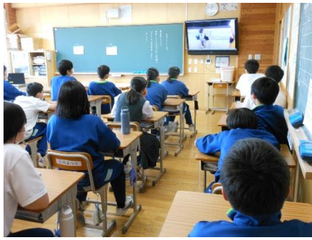
生徒会企画1 ・アメリカ報告 ・星花特別放送局 (給食委員会) (図書委員会)