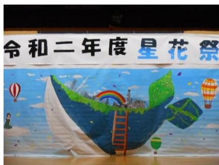
今年のステージバック