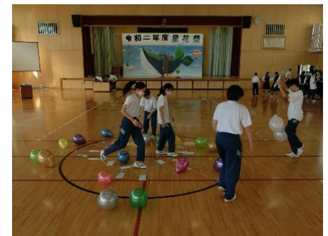
生徒会企画2 「みんなでつなげよう！秘密の暗号」