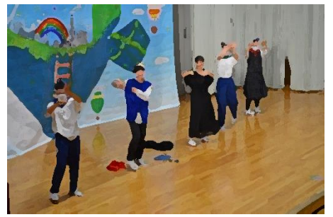
閉祭式でも、イロトリドリのダンスタイム