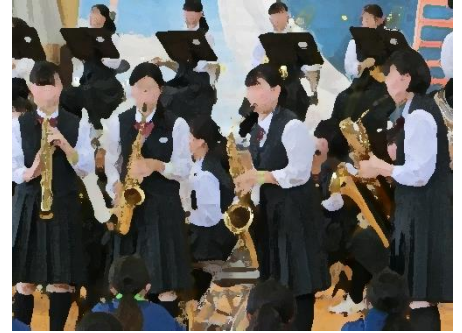
吹奏楽部のステージ (笑いあり、見せ場あり、迫力満点のステージでしたね)