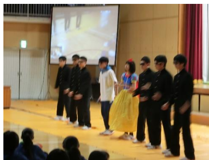
↓イロトリドリのダンス(みんなノリノリ)