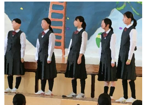
合唱部のステージ (透き通ったステキな歌声が響き渡りましたね)