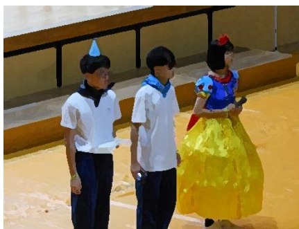
体育館と南体育館をリモートで繋いで交信↑↓