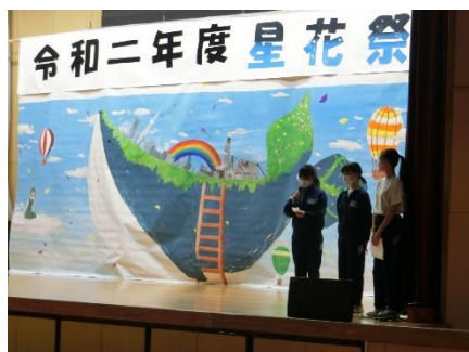
開催式の様子です

さて保護者の皆様には、コロナ禍にあって、原則無観客(一部、発表該当団体を除く)で実施させていただきました。本校が大規模校ということもあり、なかなか保護者の皆様に生徒たちの活動の様子を見ていただけないことが心苦しい思いですが、今回の星花祭の様子が少しでも伝わればと思い、写真で振り返ります。