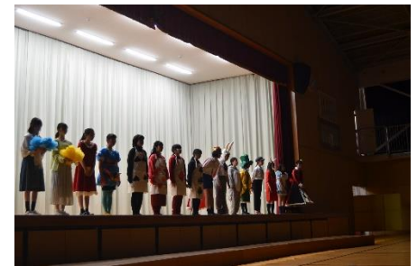
演劇部のステージ (不思議な国のアリスの世界に引き込まれましたね)