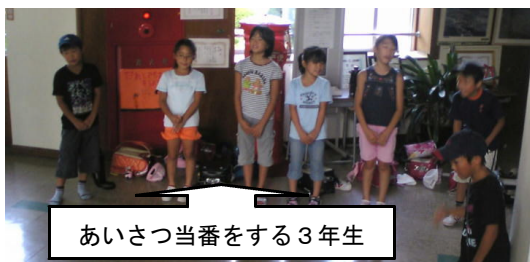
あいさつ当番をする3年生