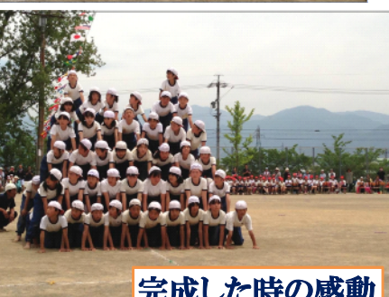
完成した時の感動