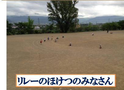
リレーのほけつのみなさん