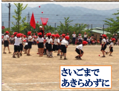
さいごまで あきらめずに