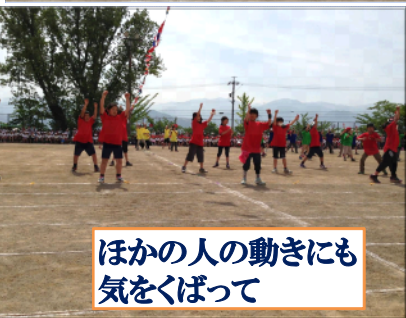
ほかの人の動きにも 気をくぼって