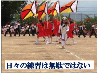
日々の練習は無駄ではない