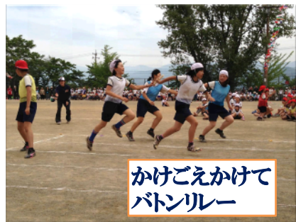
かけごえかけて バトンリレー