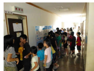
おばけ屋敷入口の賑わい