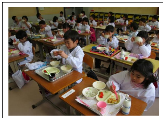
1年生 初めての給食 ～おいしいね～