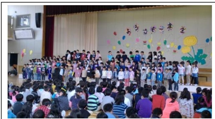
ようこそ1年生集会 ～1年生待ってたよ～