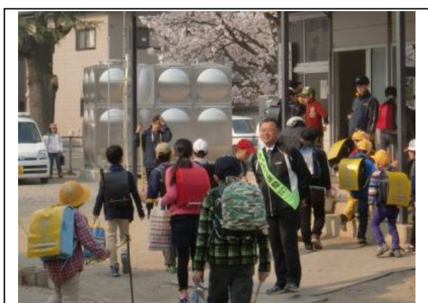
朝の登校 ～全校児童706名が 元気におはようございます～