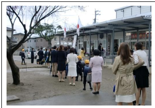
入学式 ～121名の元気な1年生が入学しました～