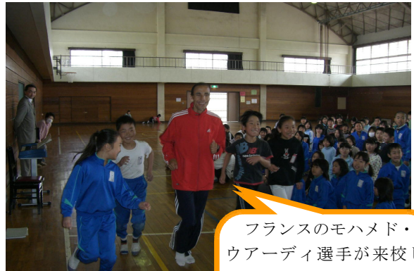
4月13日 一校一国運動交流会