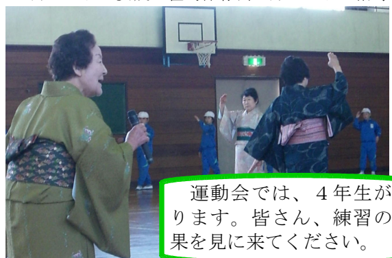
4月27日 安茂里甚句保存会の方々よりご指導