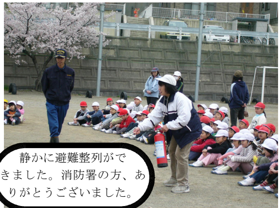
4月16日 今年度、第一回目の避難訓練