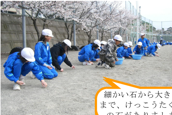
4月11日 運動会に向けて全校で石拾い