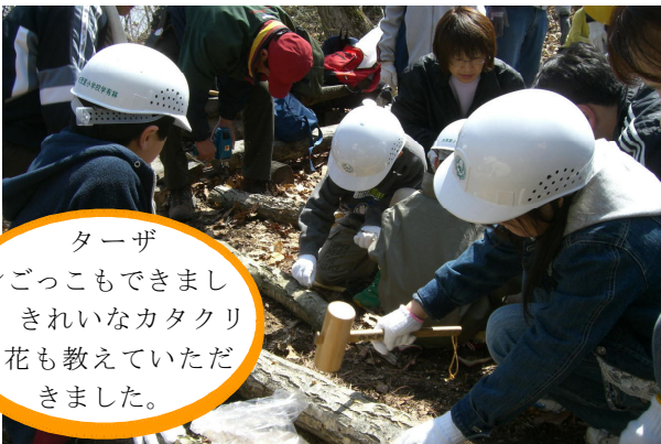
4月15日 学有林愛護会によるキノコの駒打ち