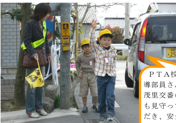
4月24日 交通安全教室