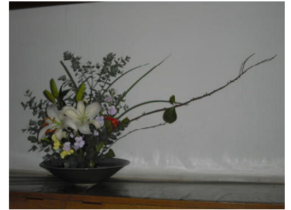
(赤心館の明るさと優しさ)

一ヶ月前の11/9 (火)の日付で書き始めた「校長室だより No.7」です。書き始めては中断し…ということが何度もあり、今日になってしまいました。タイミングを失った内容もあり申し訳なく思いますが、安茂里小学校の様子が少しでもわかっていただければありがたいと思い、発行することにしました。