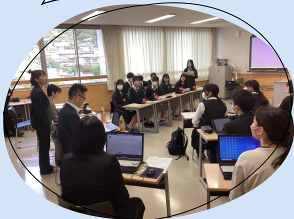
※写真は昨年度の様子

高校2年生はこれまで、それぞれの興味・関心に沿って探究活動をしています。当日は各分野の専門家の方々をお呼びして高校生の発表にアドバイスをいただきます。