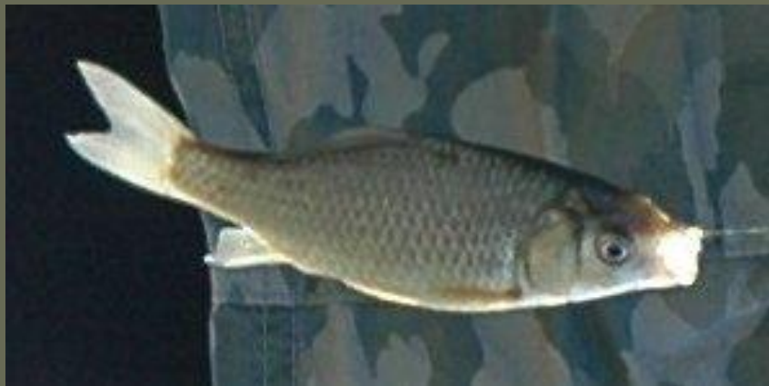
これがギンブナです。