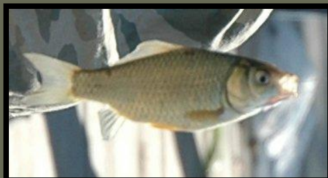
おなじくキンブナだよ

大里の池には、いろいろな、魚がいます。たとえばキンブナ、ニゴイ、ヘラブナ、メダカ、ゲンゴロウブナ、モツゴ、コイ、がいます。次に、魚の特ちょうを説明します。