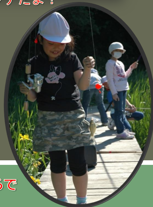
魚を、つったところです。